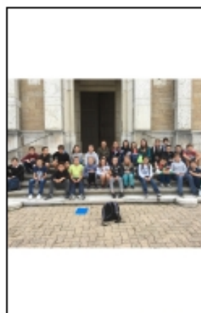
les 5èmes sur le départ

Nous sommes partis pendant 2h sur les sentiers perdus de Marboz. Nous avons du remonter le temps : finis les GPS et smartphones! Place à la boussole et à la carte IGN! Nous avons emprunté des chemins de terre, croisé des animaux, nous nous sommes cachés dans les maïs et avons par moments fait la course.