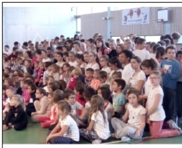
Les élèves au gymnase

Jeudi 22 octobre, tous les élèves de l'école St Joseph et du collège St Pierre ont pris le départ pour la nouvelle édition du cross annuel, événement organisé et encadré par C;Convert, professeur d'EPS. Elle était aidée par ses collègues et ses élèves de 3ème. Une belle journée ensoleillée très attendue par les élèves et placée sous le thème des jeux de Londres.