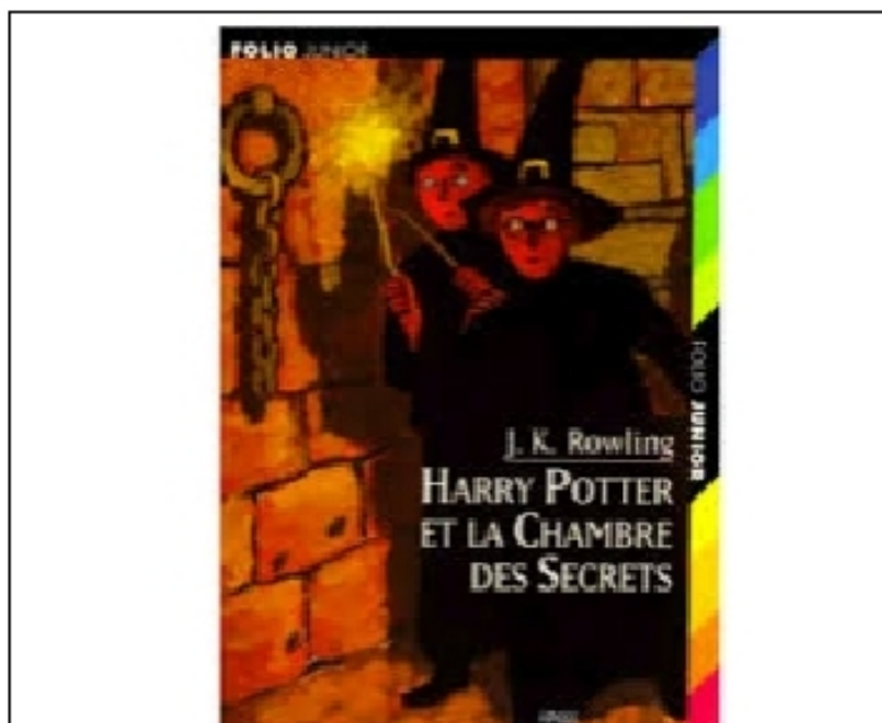
Harry Potter et la chambre des secrets