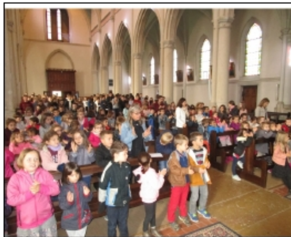
Les écoliers et collégiens réunis à l'église