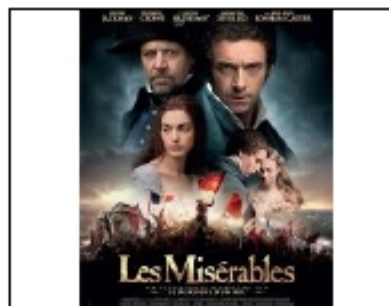
Les misérables - le film

Evadé de prison, il sauve la fille de Faustine, Cosette, confiée aux terribles Thénardier et à leurs deux filles ; et se cache avec elle dans un couvent.