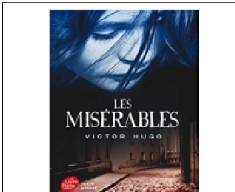
Les misérables - le livre

Quelques années plus tard, c'est la révolte à Paris. Marius, étudiant républicain qui manifeste, fait la connaissance de Cosette et en tombe amoureux. Il rencontre également Gavroche, un jeune garçon parisien, qui participe à l'émeute.