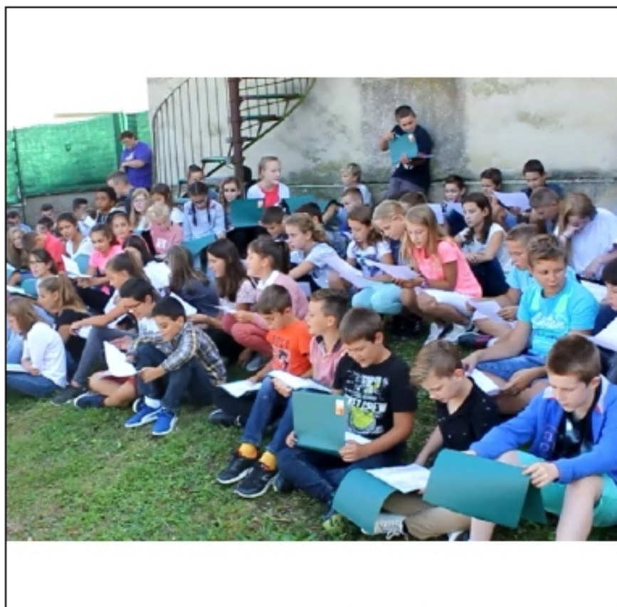
Sacré Charlemagne entonnée par les collégiens le jour de la rentrée