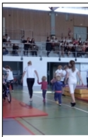
Petits et grands

Puis les élèves de l'école maternelle sont entrés en piste. Chaque petit, aidé par un grand de 3ème, a effectué un parcours où vélo, trottinette et gymnastique ont alterné ; une façon ludique de participer eux-aussi aux festivités! Chacun a choisi sa récompense parmi les multiples peluches offertes par les collégiens.